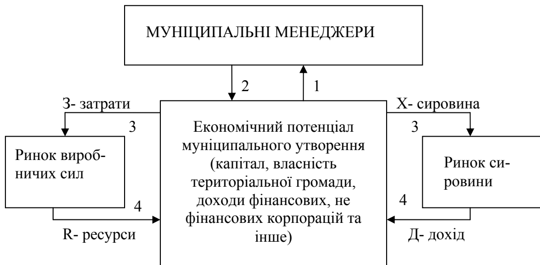
Рис.1. Відтворення економічного потенціалу муніципального утворення

Схематично це можна представити таким чином (рис.1).