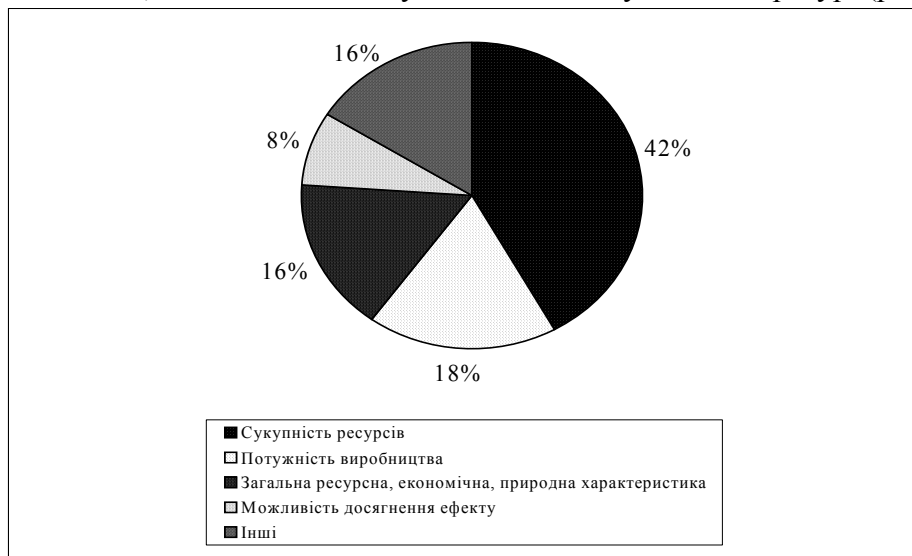
Рис.1. Класифікація ознак поняття «потенціал» за Н.Т.Ігнатенко та В.П.Руденко

Цікавою щодо цього є запропонована Н. Т. Ігнатенком та В. П. Руденком класифікація ознак поняття «потенціал», загальноновживана у вітчизняній науковій літературі (рис. 1.).